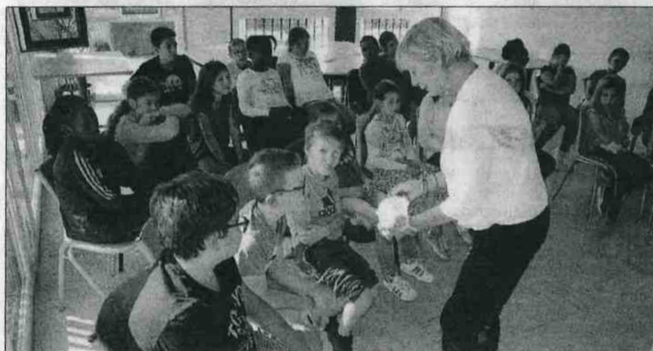
L'intervenante leur fait goûter du lait caillé.

Depuis plus de 20 ans, La Boutique info se mobilise pour les Journées du goût. Les bénévoles ont accueilli lundi, mardi et jeudi, à l'espace culturel, les écoliers, les jeunes de la MFR et ceux de l'EPMS de Chancepoix. Le produit mis en avant cette année était le fromage. L'équipe