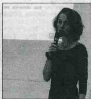
Des conseils pour mieux aborder cette évolution de la réglementation.

La dématérialisation des procédures de passation de marchés publics se développe pour les entreprises et les administrations. Pour informer et préparer petites entreprises et élus à l'évolution de la réglementation, la Communauté de communes Gâtinais-Val de Loing, avec l'agence Seine-et-Marne Attractivité et la Direction des marchés publics 77, organisait une réunion d'information le 15 octobre.