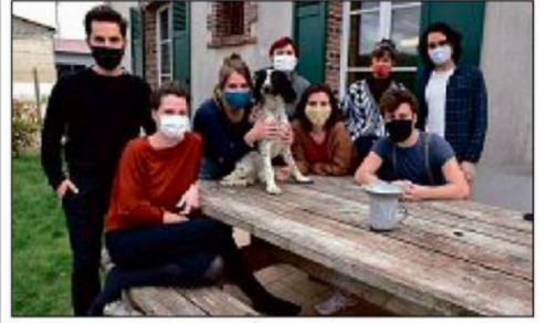
La compagnie « Les huit qu'on pose »... en pause !

► Depuis une douzaine de jours, une jeune troupe de comédiens parisiens a investi le gîte de Pilvernier, près de Mondreville, pour préparer un spectacle théâtral immersif programmé en septembre.