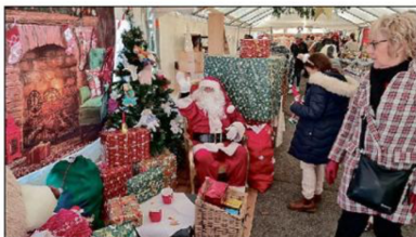
Le Père Noël, toujours disponible pour les enfants.

► Samedi, à 10 heures précises, le coup d'envoi du marché de Noël de Chaintreaux a été donné. Les nombreux visiteurs déjà sur place ont assisté à une inauguration musicale, dansante et très colorée. Ce marché soutenu par la municipalité a été le premier proposé par Chaintro-Fêtes, anciennement Chaintro Fun.