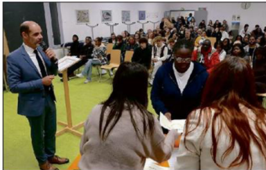
Élèves et parents sont venus nombreux assister à la Cérémonie de remise du diplôme national du brevet.

► Vendredi 17 novembre en fin de journée, s'est tenue dans les locaux du collège Emile-Chevallier la cérémonie républicaine de remise du diplôme national du brevet.