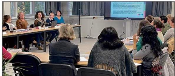
Le projet « Jeunesse » chemine ponctué par de nombreuses réunions pour y parvenir.

Les élus travaillent sur ce projet depuis de nombreu-