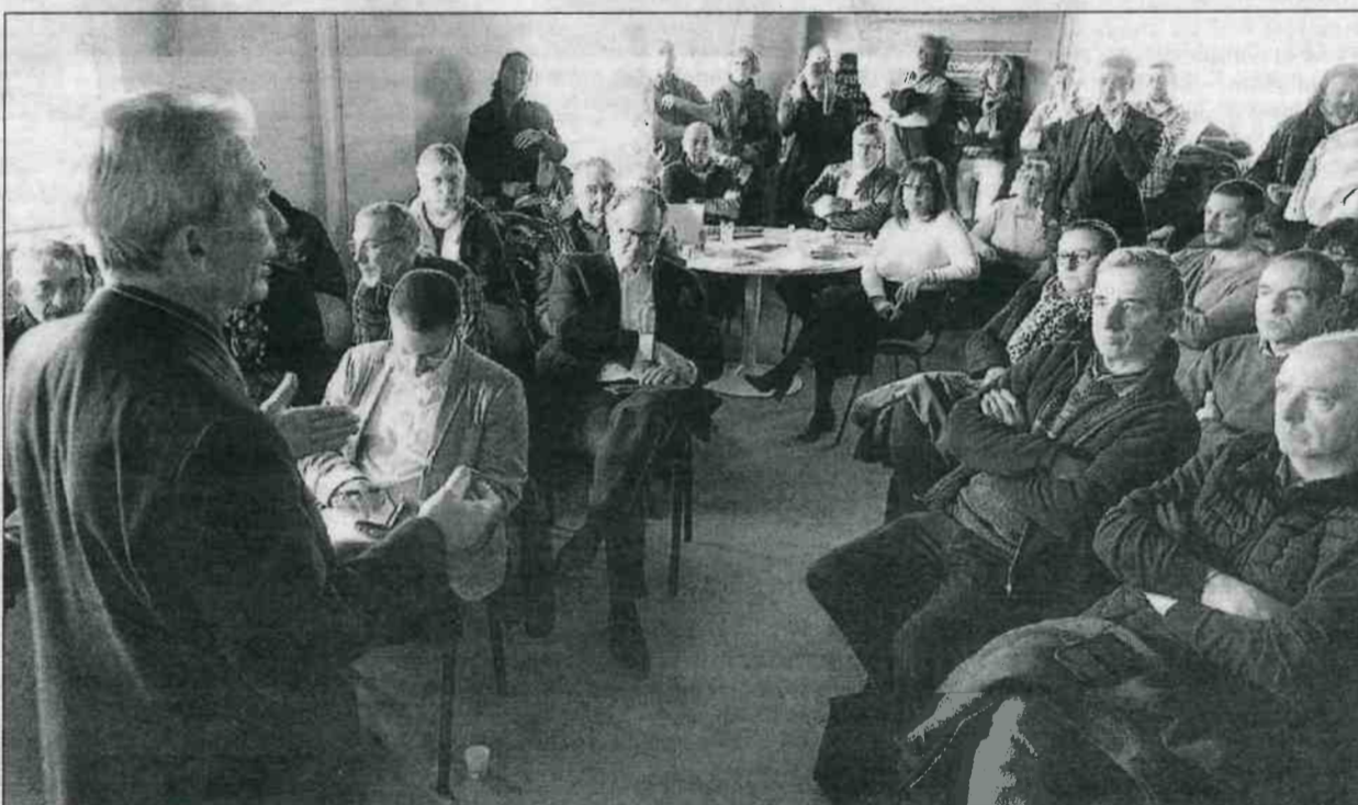
Un petit-déjeuner des entrepreneurs pour découvrir le service de développement économique de la CCGVL. Mais aussi les aides pour créer son entreprise ou son commerce et les développer.