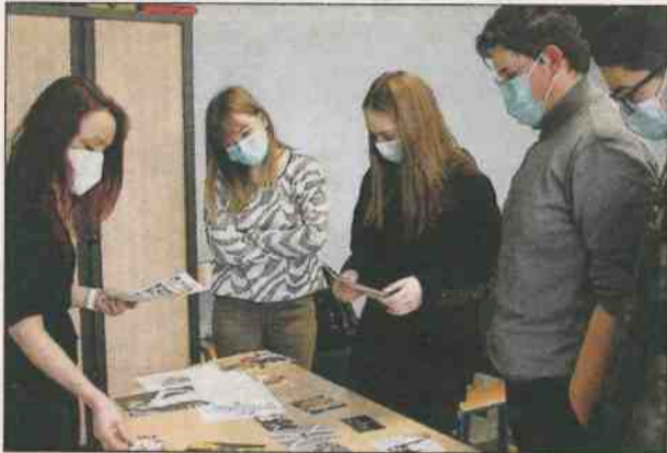
Chacun choisit un personnage qu'il va faire parler et incarner.

Pendant la moitié des vacances, l'EPMS Chancepoix continue d'accueillir les jeunes pour des activités ludiques et culturelles différentes du quotidien. Ainsi l'équipe éducative avait invité l'association MusiQafon pour un atelier d'initiation au slam et un atelier de musique assistée par ordinateur, encadrés par des professionnels.