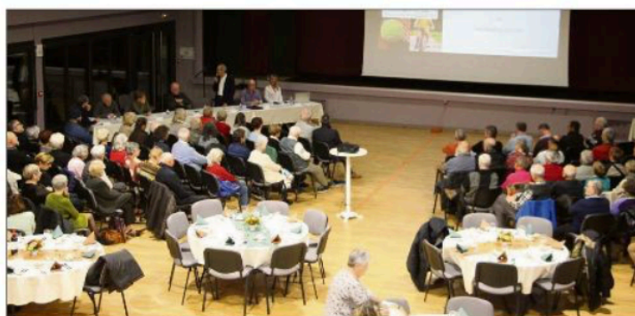
Des participants attentifs et impliqués.