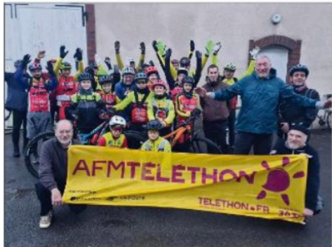
Ce sont les cyclistes qui ont débuté la journée de solidarité.

► Samedi 6 décembre, la commune de Chaintreaux s'est une nouvelle fois rassemblée à l'occasion du Téléthon. Associations, bénévoles et habitants ont uni leurs forces pour une journée riche en activités pour soutenir l'AFM-Téléthon et des familles touchées par les maladies neuromusculaires.