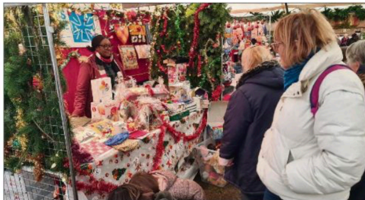
Les exposants ont rivalisé d'imagination pour décorer leurs stands.

► Les 6 et 7 décembre, Souppes-sur-Loing a vécu au rythme de la magie des fêtes avec son 28 e marché de Noël, placé sous le thème Noël aux chandelles. Le centre-ville s'est transformé en véritable village enchanté où artisans, producteurs et exposants proposaient leurs créations, spécialités gourmandes et idées cadeaux. À l'inauguration, le maire, Pierre Babut a remercié les élus, le personnel communal et les bénévoles. Dès samedi matin, l'arrivée du Père Noël en calèche marquait le coup d'envoi d'un programme festif et musical. Concerts, spectacles, défilé et élection du pull de Noël le plus original rythmaient la journée, avant de laisser place dimanche, à de